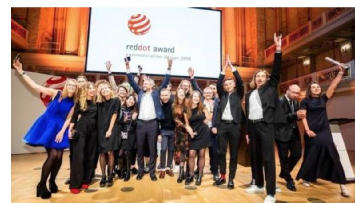
Red Dot Design-Awards

ProSiebenSat.1 kauft Online-Partnervermittler