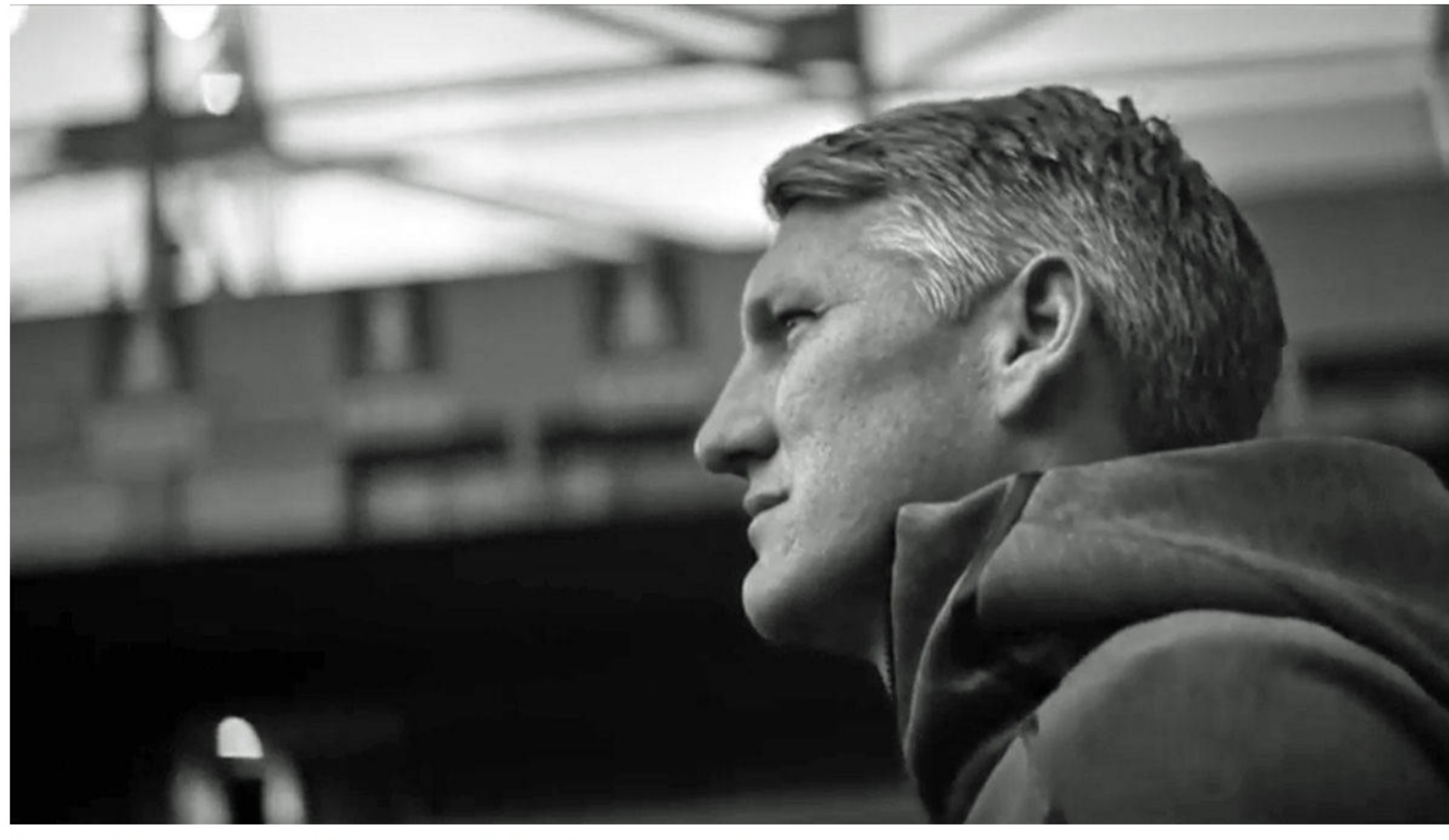
Bastian Schweinsteiger soll das Image der Spielautomaten aufbessern.